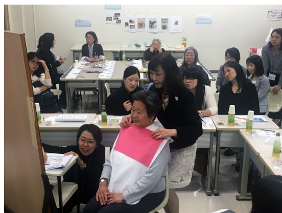
みなさん真剣です