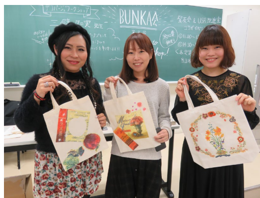
素敵なバッグの完成です！！