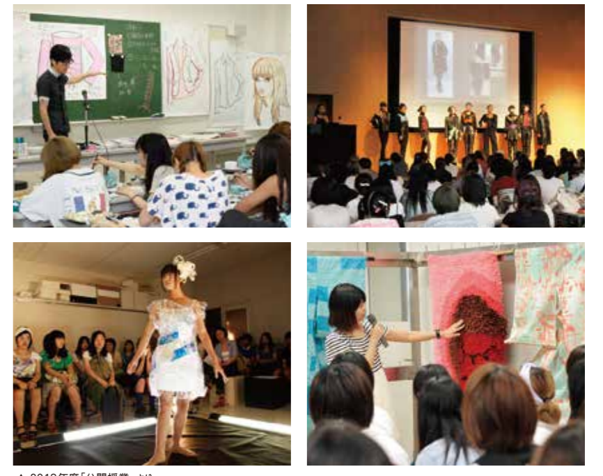
▲ 2013年度「公開授業」より

AO入試1期エントリー受付中 A館L階 [入試広報課] 窓口にて18:30までエントリーを受付ています。 (エントリーには、エントリー書類が必要です。)