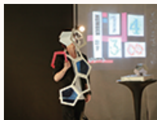
▲ファッションショー形式による インテリアデザインのプレゼンテーション

【専門職：建築設計、インテリアデザイナー、リフォームプランナー、施工管理等】 (株)アドヴァン／(株)I-PLAN(一級建築士事務所)／(株)池下設計／(株)一条工務店／(株)大塚家具 ／近藤建設(株)／(株)シミズオクト／新館建設(株)／スウェーデンハウス(株)／積水ハウス リフォーム(株)／(株)匠設計コンサルタント／タマホーム(株)／(株)塚本工務店／東京ガス ライフパル TAKEUCHI(株)／(株)ニチベイ／パナソニック ホームエンジニアリ ング(株)／(株)ファイブイズホーム／(株)富士住建／(株)藤田建装／ホームテック(株)／ (株)マルニ木工／ミサワホームイング(株)／三井ホーム(株)／(株)三和エフエムデザイン／ (株)村内ファニチャーアクセス／(株)モリヤ総合設備／(株)山一ホーム／(株)ウエウ リフォ パーク新潟／(株)夢・建築工房／(株)夢真ホールディングス／(株)レオパレス21／ (株)ロイズ／(株)脇木工／(株)ワット・コンサルティング 【一般職、事務職】 (株)エーピーシー商会／タクトホーム(株)／(株)ニッポン放送／前田建設工業(株) 他多数