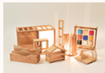
▲あきる野市、秋川木材共同組合との 地域連携教育事業