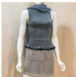
New techniques to renovate traditional weaving techniques