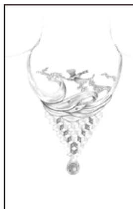
法人会会長特別賞 「かわせみ」