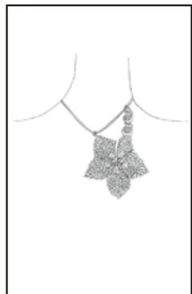
審査員特別賞 「Life of flowers」