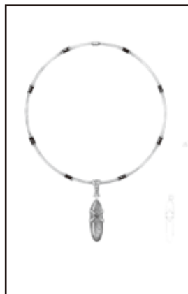
準グランプリ 「ノスタルジア(追憶)」