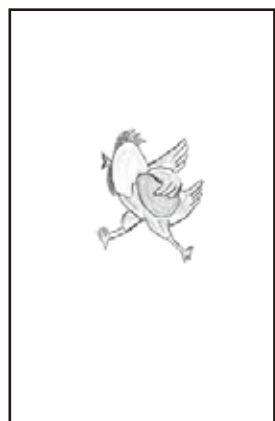
法人会会長特別賞 「躍動」