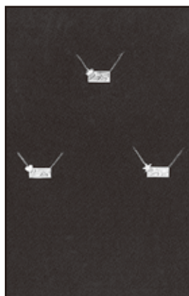
糸魚川ヒスイ商組合賞 「ホップ・ステップ・ジャンプ」