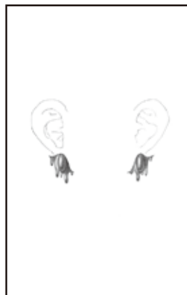
糸魚川ヒスイ商組合賞 「eye」