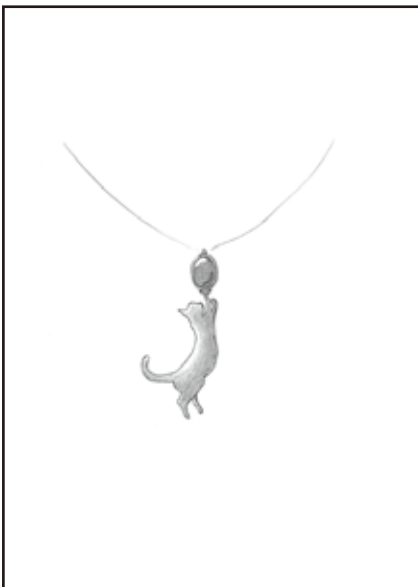
製品化デザイン賞 「ネコジャンプ」