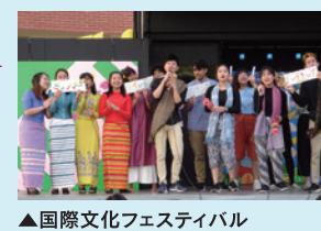
▲国際文化フェスティバル

日程 4日 時間 12:00~13:00 場所 プラザ野外ステージ (雨天時D70)