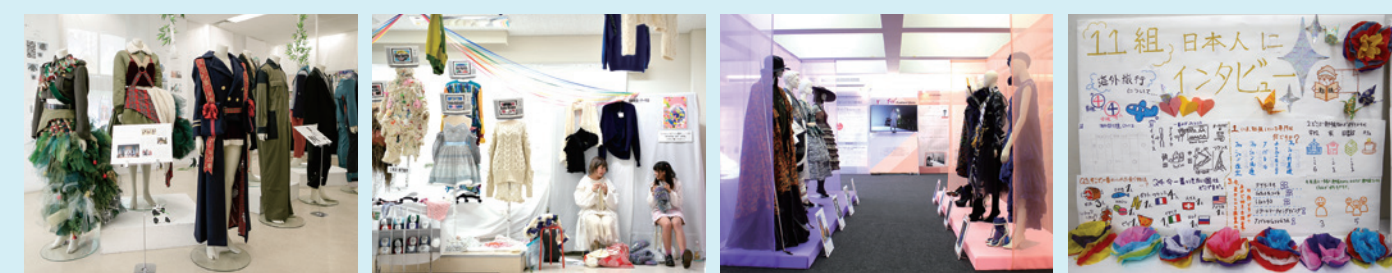
▲文化学園大学 ▲文化服装学院 ▲文化ファッション大学院大学 ▲文化外国語専門学校