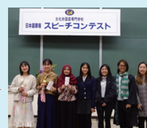
▲日本語スピーチ大会