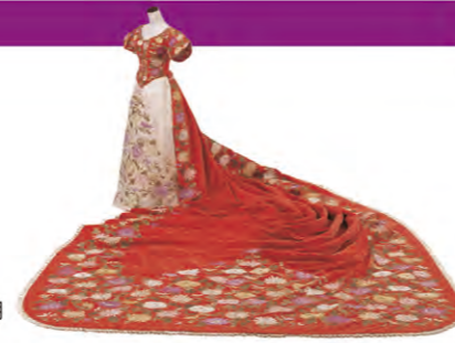
大礼服 明治20年代末 昭憲皇太后着用