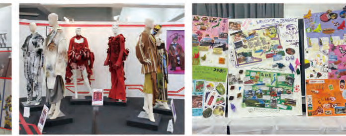
▲文化ファッション大学院大学