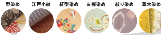
型染め 江戸小紋 紅型染め 友禅染め 絞り染め 草木染め

「染の小道」で飾られるのれんは、プロの染色作家から染色を勉強する学生までが、それぞれの技量に応じて、さまざまな技法を駆使して制作しています。どんな工程でつくったのか、できあがった作品から想像を巡らせてみるのもまた一興です。