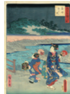
江戸百三十八興「落合はたる」歌川豊国、歌川(二代)広重元治元年(1864年)新橋歴史博物館蔵

江戸が育てた手描き友禅や小紋など、伝統を受け継いだ技術や文化が落合・中井界隈には今でも息づいています。